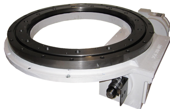
HIGH SPEED TOROIDAL INDEXERS TESTE A DIVIDERE TOROIDALI AD ALTA VELOCITA'

PLEASE CONTACT OUR TECHNICAL OFFICE FOR FURTHER INFORMATION CONTATTA IL NOSTRO UFFICIO TECNICO PER ULTERIORI INFORMAZIONI