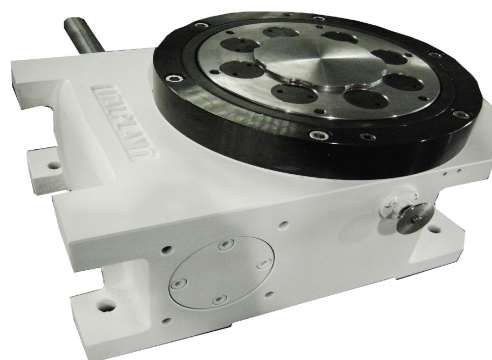
ADJUSTABLE TRANSMISSION TORQUE (ATT) WITH SAFETY OUTPUT TORQUE LIMITER (SOTL) INTERMITTORI CON REGOLAZIONE DELLA COPPIA TRASMESSA E LIMITATORE DI COPPIA DI SICUREZZA IN USCITA